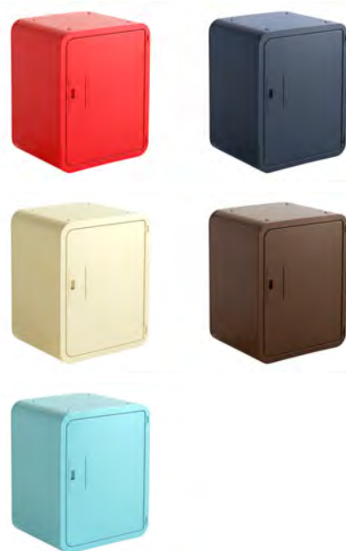
スマポ STANDARD 宅配ボックスタイプ