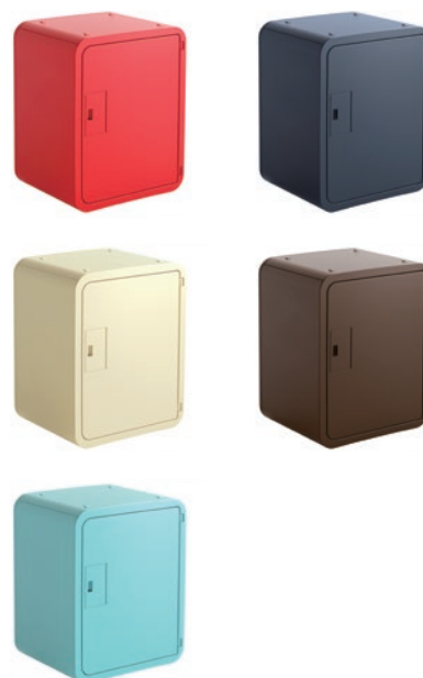
スマポ STANDARD 宅配ボックスタイプ