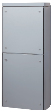
本体色 ■ ライトグレー フロントパネルシート色 ■ シルバーメタル