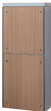
本体色 ■ ライトグレー フロントパネルシート色 ■ ライトウォールナット