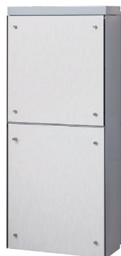
本体色 ■ ライトグレー フロントパネルシート色 □ ホワイトウッド