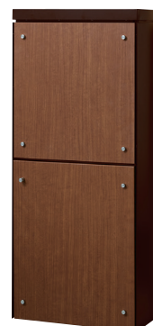
本体色 ■ ダークブラウン フロントパネルシート色 ■ ミディアムウォールナット