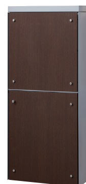
本体色 ■ ライトグレー フロントパネルシート色 ■ ダークオーク