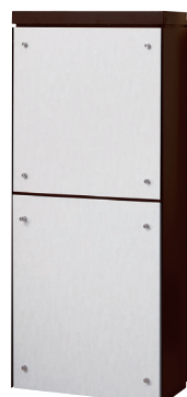
本体色 ■ ダークブラウン フロントパネルシート色 □ ホワイトウッド