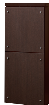
本体色 ■ ダークブラウン フロントパネルシート色 ■ ダークオーク