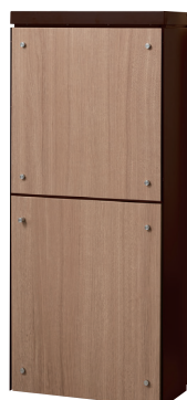
本体色 ■ ダークブラウン フロントパネルシート色 ■ ライトウォールナット