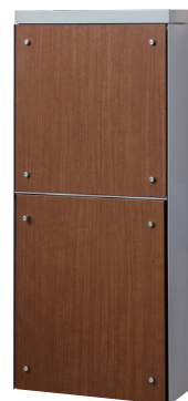
本体色 ■ ライトグレー フロントパネルシート色 ■ ミディアムウォールナット