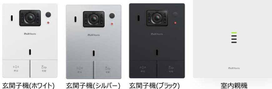
玄関子機(ホワイト)